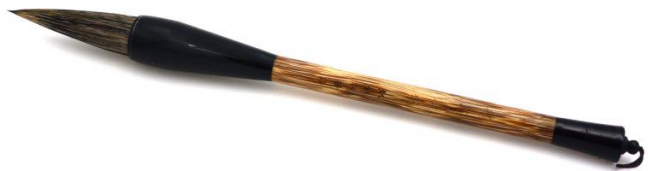
Le pinceau, mao pi [ 毛筆 ]