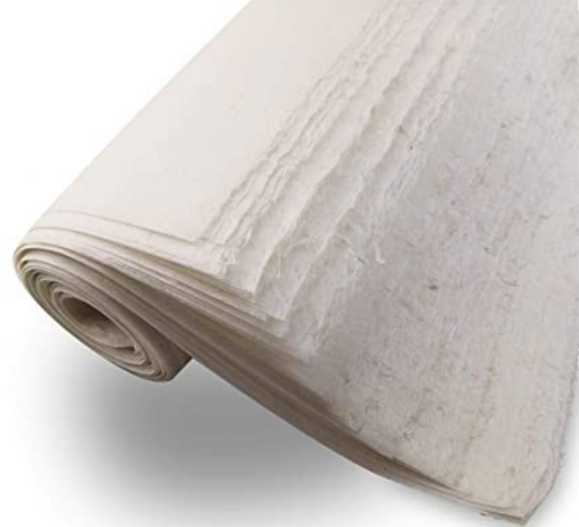
Le papier, tche [ 紙 ]