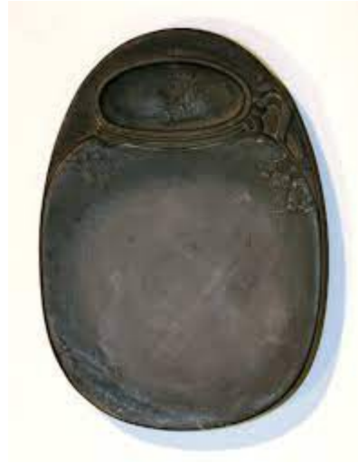
la pierre à encre, yen [ 硯 ]