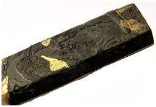
l'encre, mo [ 墨 ]